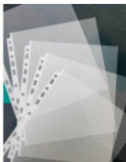
*Sheet protectors -Protectores de páginas